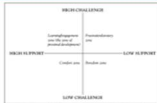
Figure 1.1. Four Zones of Teaching and Learning (adapted from Mariani 1997)